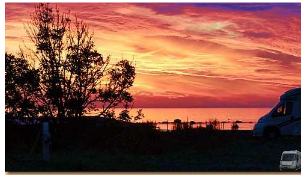
So empfängt uns der heutige Tag

Bilder mit Rollover-effekt, d.h. sie ändern sich nach überfahren mit der Maus!